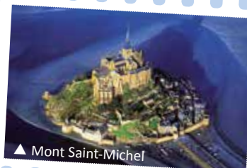
▲ Mont Saint-Michel

Wonder of the West" Mont Saint Michel is situated in the heart of an immense bay invaded by the highest tides in Europe. Joined the heritage of UNESCO in 1979.